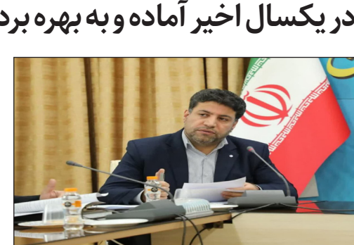
استان برتر کشور و هیئت ورزش‌های همگانی استان همدان پایلوت غرب کشور است. مدیر کل ورزش و جوانان استان همدان عنوان کرد: در بحث