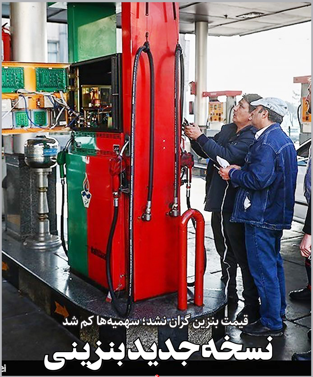
قیمت بنزین گران نشد؛ سهمیه‌ها کم شد