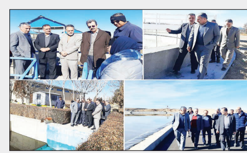
معاون مهندسی و توسعه شرکت مهندسی آب و فاضلاب کشور در ادامه این سفر ضمن بازدید از مراحل بهره برداری آزمایشی از مدول دوم تصفیه