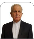
دکتر رؤف پیشدار استاددانشگاه

ما نمی توانیم شعار گفتگو با جهان را بدهیم، اما در خانه حاضر به صحبت با هم نباشیم و نخواهیم صدای دیگری را بشنوم. برون داد چنین رفتاری، تصویر و تصور وجود جامعه‌ای است که در آن هر کس ساز خودش را می زند و با مفاهیمی مانند دموکراسی، قانون اساسی و انتخابات بیگانه است.