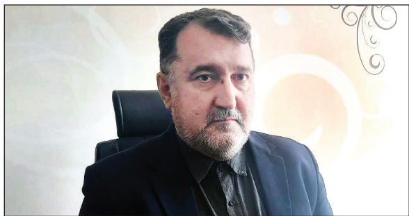
یک جامعه شناس: خانواده‌ها مراقب فرزندانشان باشند