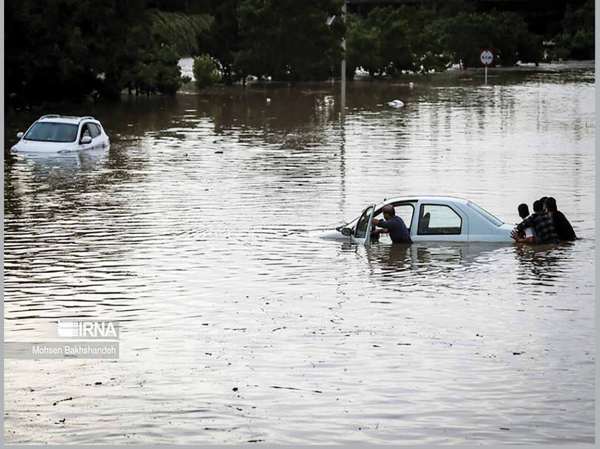
سیل در مشهد