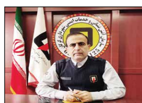
نقش اقتصاد - گلستان - حمیده عرب: رئیس سازمان آتش نشانی و خدمات ایمنی شهرداری گرگان از خریداری و حفاظت تجهیزات عملیاتی و حفاظت فردی ویژه آتش نشانیان مرکز استان گلستان

خبر داد. موسی الرضا صفری اظهار کرد: حفظ جان و مال شهروندان از جمله مهمترین وظایف سازمان‌های آتش نشانی است که می‌طلبید برای این مهم سازمان‌ها به ایمن‌ترین تجهیزات ممکن مجهز شوند. وی با بیان اینکه به همین دلیل سازمان آتش نشانی شهرداری گرگان در فاز نخست نسبت به خرید البسه و تجهیزات مورد نیاز اقدام کرد، افزود: البسه خریداری شده ۶۰ میلیارد ریال ارزش دارد. رئیس سازمان آتش نشانی و خدمات ایمنی شهرداری گرگان خاطر نشان کرد: لباس‌های عملیاتی در چه یک، فیس (ماسک) و کپسول‌های تنفسی، طناب استاتیک، شیلنگ‌های ضد آتش، دستکش و بستک (سبک) مورد نیاز جزم مهم‌ترین اقلام خریداری شده است. وی آموزش ایمنی و چگونگی استفاده از خاموش‌کننده‌ها برای کارکنان این مراکز را از ضروری دانست و گفت: بالاتر از آگاهی متصدیان جایگاه‌های سوخت نسبت به موارد ناایمن و نحوه مقابله با حوادث احتمالی به خصوص کار با خاموش‌کننده‌های دستی و اطفاء حریق در همان لحظات اولیه به افزایش میزان ایمنی این مکان‌ها برادر. بر آتش‌سوزی و پیشگیری از هرگونه حادثه کمک مؤثری نماید.