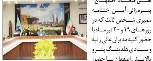
نقش اقتصاد - اصفهان - پیسره زالی: آیین اختتامیه ممیزی شخص ثالث که در روزهای ۱۹ و ۲۰ تیرماه با حضور کلیه مدیران عالی رتبه و ستادی هلدینگ پترو پالایش اصفهان با حضور

کارشناسان متخصص و ارزیاب خارجی توسط شرکت آراین توف پاسارگاد، انجام شد تمامی قسمت‌ها، معاونت‌ها، بخش‌های اجتماعی و فرهنگی، آموزش، عملیات، خدمات و... هلدینگ پترو پالایش مورد ممیزی قرار گرفت. به گزارش خیرنگار واحد روابط عمومی و بین الملل هلدینگ پترو پالایش اصفهان، در ممیزی شخص ثالث که تیرماه امسال به مدت ۲ روز با حضور کارشناسان کلیه بخش‌های پالایشگاه اصفهان انجام شد، کارشناس نقاط قوت اقدامات انجام شده در بخش‌های آموزش HSE، تولید، چشم انداز طرح‌های در حال اجرا، مدیریت ریسک، مدیریت دانش و تعالی منابع انسانی، روابط عمومی و محیط زیست، به کارگیری فناوری‌های نوین، استفاده از فنوآرهای جدید ارتباطی و SAP، انجام مسولیت‌های اجتماعی، به کارگیری اقدامات نوین در راستای مدیریت بحران و پدافند غیر عامل را ابراز داشتند و بر رق نقاط قابل بهبود در پالایشگاه اصفهان تاکید کردند.