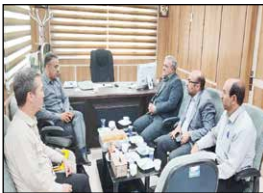
نقش اقتصاد - اراک - عابدی: به گزارش روابط عمومی جلسه‌ای با حضور مهندس عسکری مدیر کل، دکتر افروز معاون توسعه و عمران روستایی بنیاد مسکن انقلاب اسلامی استان مرکزی و دکتر محمدی مدیر کل منابع طبیعی استان و سایر اعضا در محل اداره کل منابع طبیعی برگزار گردید.

در این جلسه مهندس عسکری از اقدامات و تعاملات سازنده مدیر کل منابع طبیعی با بنیاد مسکن در جهت پیشبرد اهداف مشترک تقدیر و تشکر نمود و همچنین در خصوص اجرای قانون جیش تولید مسکن در اراضی روستایی و رفع مشکلات و موانع در روند تحویل اراضی ملی به بنیاد مسکن بحث و تبادل نظر گردید.