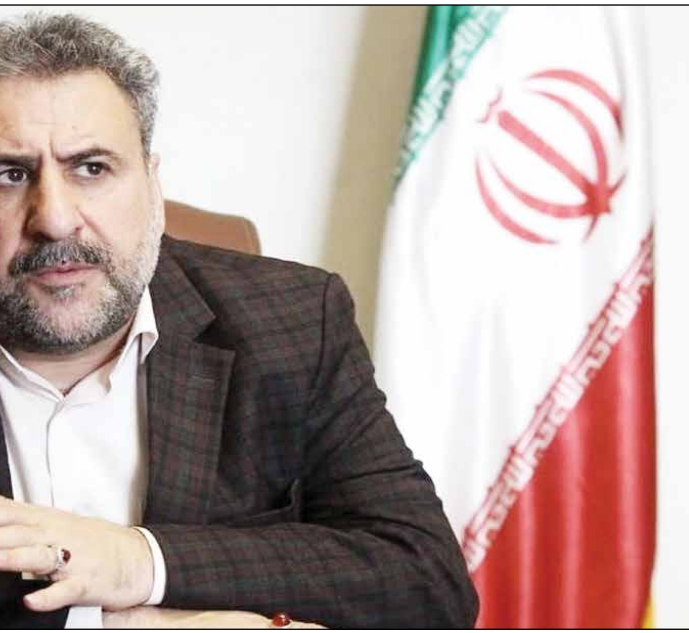
نایب رئیس هیئت مدیره سازمان ملل

باشند.دومین موضوع، طالبان بود. اتفاقی که افتاد این بود که بخش عده‌ای که آمدند نظامیان بودند. ۳۵۰ هزار نفر لشکر دولت افغانستان بود. دولت افغانستان ۱۳۵ میلییارد دلار وام و کمک خارجی گرفت که اصلاحات در حوزه‌های مختلف از جمله نظامی انجام دهد. این‌ها هر شش نفر در مقابل یک نفر دوام نیاوردند.