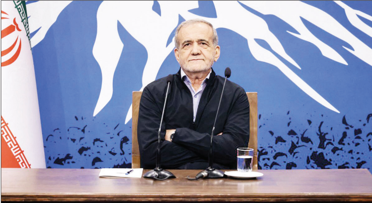
مسعود یزشکیان، وزیر امور خارجه ایران

گروسی، مدیرکل آژانس بین‌المللی انرژی اتمی خواستار «شفافیت بیشتر از سوی ایران» و همچنین «صلاحت و بهره‌رسانی‌های برنامه هسته‌ای ایران» در روابط تهران با این نهاد پادمانی شده است. گروسی گفته که امیدوار است به زودی به ایران سفر کند تا در این زمینه با رئیس‌جمهور جدید رایزنی داشته باشد. به باور ناظران در دوران وزارت عباس عراقچی، دستگاه دیپلماسی ایران احتمالاً از انعطاف کافی برای انجام مذاکرات برخوردار خواهد بود، شاید حتی بیشتر از دوران ریاست‌جمهوری حسن روحانی، تیم مذاکره کننده ایران عملکردی باشد و فارغ از مخالفت‌خوانی‌ها در داخل بتوانند شرایط را برای رایزنی‌ها بهبود بخشند.