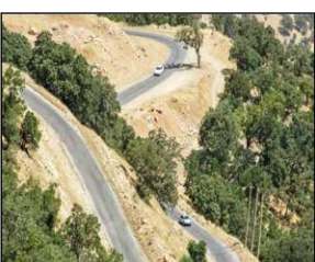
نقش اقتصاد- یاسوج- طبیعی: مردم و مسئولان محلی خواستار رسیدگی هر چه زودتر به وعده های دولت استانی و شهرداری هستند.

نزدیک به ۱۲ هزار سکنه بخش زلیبای شهرستان مارگون هر گاه برای سفر به مرکز استان یا شهرستان دل به جاده باریک و پرپیچ و خم زلیبای می زنند، دلخوار و خدنگ در اتفاقی ناگوار در گردنه‌های معروف به گردنه گچ رادارند، گردنه‌ای با پیچ‌های خطرناک و شیب تند و پر از سنگ و خاکی که هر آن احتمال ماندن خودرو یا سقوط به دره در آن وجود دارد.