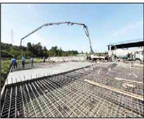
نقش اقتصاد- گیلان- منگونی: ۵ نیروگاه مولد مقیاس کوچک در کلان شهرستان های ماسال، رضوانشهر، صومعه سرا و آستانه اشرفیه احداث می شود. حسن والی

مجری طرح تولید پراکنده شرکت برق منطقه‌ای گیلان خیرداد: آغاز عملیات اجرایی ۵ نیروگاه مقیاس کوچک در مناطق جغرافیایی مختلف استان گیلان