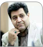
حسین سلاح‌ورزی رئیس پیشین اتاق بازرگانی ایران