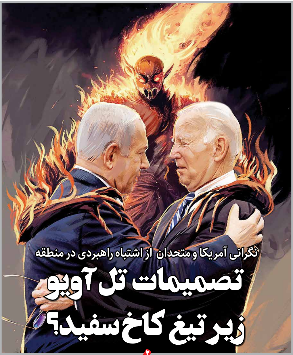
نگرانی آمریکا و متحدان از اشتباه راهبردی در منطقه تصمیمات کل آویو زیر تیغ کاخ سفید؟