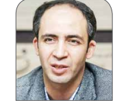
وحید شافقی اقتصاددان