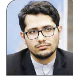
نود کمالی کارشناس مسائل راهبردی و سیاست خارجی